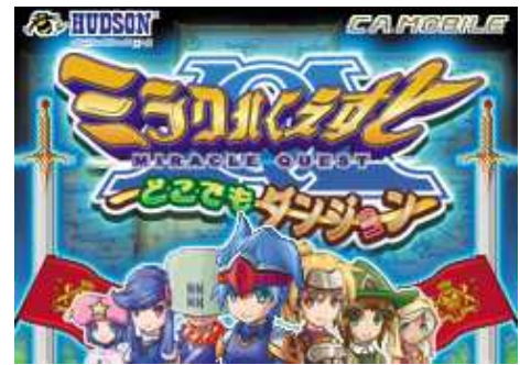
Original soft ©by HUDSON

本作は、ケータイ初の本格的なオリジナルネットワーク・ロールプレイングゲーム「ミラクルくえすと」のシリーズの最新作です。「iモード ® 」「EZweb」「Yahoo!ケータイ」の3キャリア対応です。また広告枠に関しては、シーエー・モバイルより販売予定です。